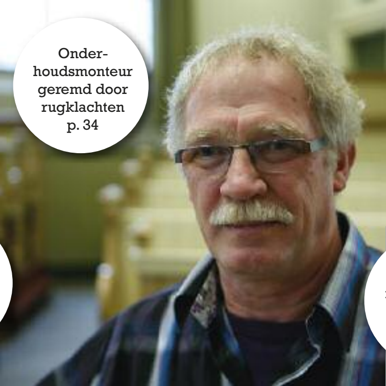
Onder- houdsmonteur geremd door rugklachten p. 34