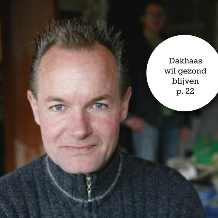
Dakhaas wil gezond blijven p. 22