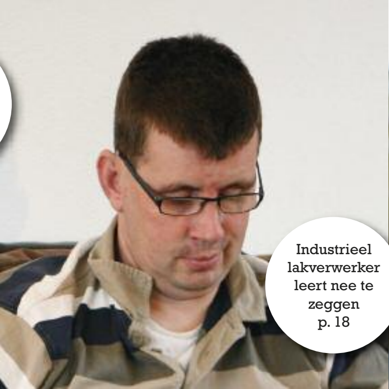
Industrieel lakverwerker leert nee te zeggen p. 18