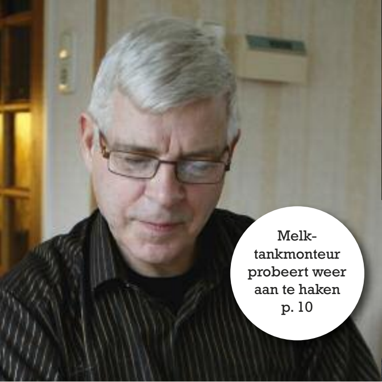
Melk- tankmonteur probeert weer aan te haken p. 10