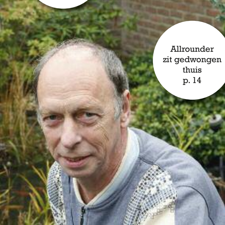
Allrounder zit gedwongen thuis p. 14