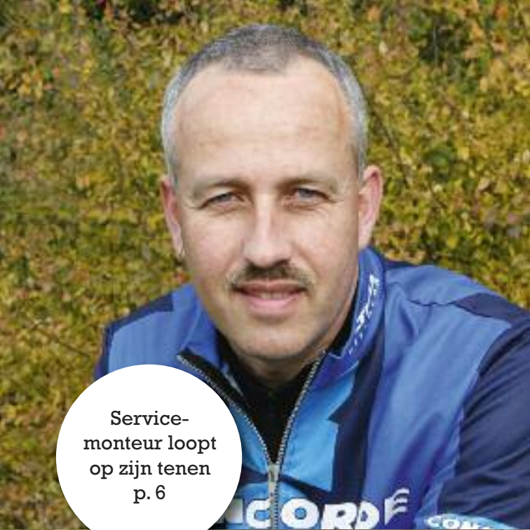
Service- monteur loopt op zijn tenen p. 6