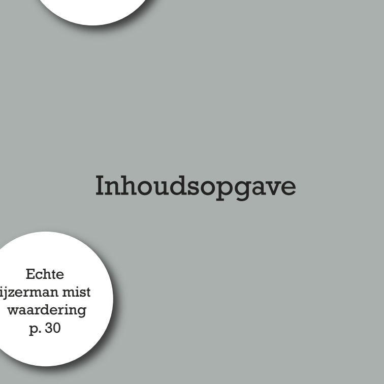
Echte ijzerman mist waardering p. 30