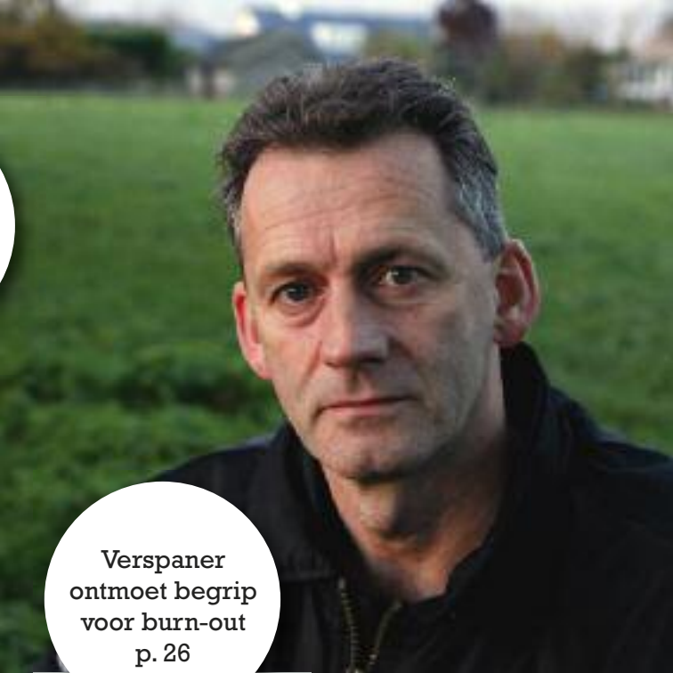
Verspaner ontmoet begrip voor burn-out p. 26